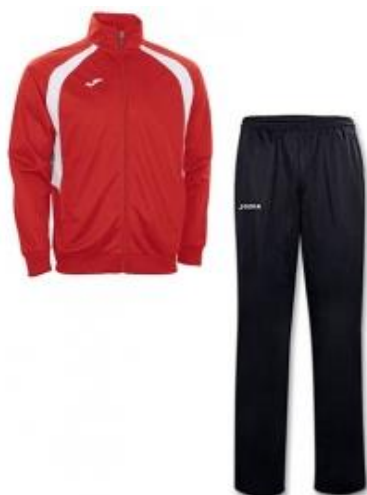
Xandall complet 38€ (1*)