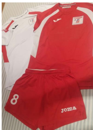
Equipatge jugador/a 50€ (1 a i 2 a samarreta i pantalons)